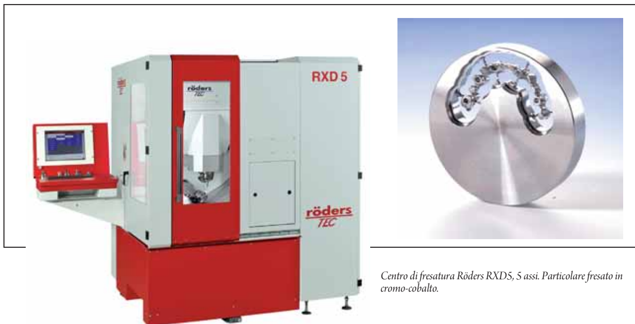
Centro di fresatura Rödgers RXD5, 5 assi. Particolare fresato in cromo-cobalto.

mente rigida ma che permette un'elevatissima dinamica, grazie anche ai motori lineari su tutti gli assi.