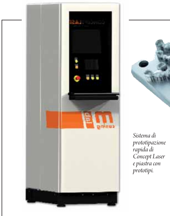
Sistema di prototipazione rapida di Concept Laser e piastra con prototipi.